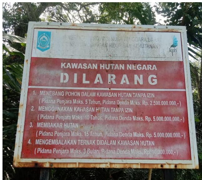
Gambar 4. Penguatan rehabilitasi hutan kawasan DAS Mrnting.

Program HKm Wana Lestari juga mendorong rehabilitasi lahan kritis di kawasan DAS Meninting. Melalui kegiatan penanaman pohon dan pengendalian erosi, program ini membantu memulihkan fungsi ekologis DAS, meningkatkan kapasitas penyerapan air tanah,