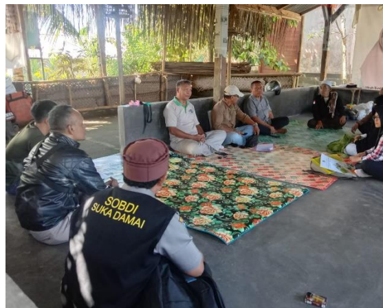
Gambar 5. Pertemuan dengan Gapoktan Wana Lestari di Desa Bukit Tinggi

Berdasarkan hasil diskusi bersama Gapoktan dan Kepala Desa, ada beberapa nilai positif yang bisa ditemui dalam kaitan dengan pengelolaan DAS Meninting (Gambar 5), yaitu: