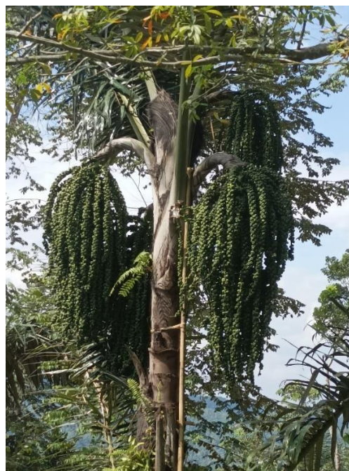
Gambar 7. Salah satu andalan ekonomi petani