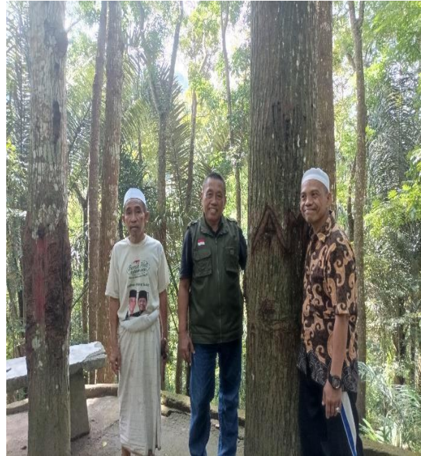
Gambar 3. Bersama Ketua Gapoktan dan Ketua BPD Desa Bukit Tinggi di dalam kawasan HKm