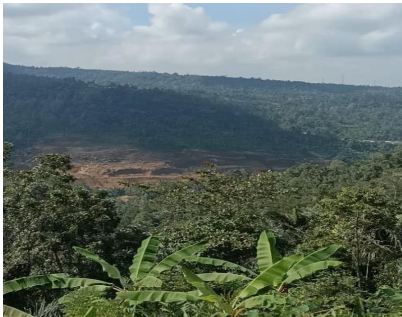
Gambar 1. Lokasi Pembangunan Bendungan Bukit Tinggi dari pandangan atas

Curah hujan di wilayah hulu DAS Meninting termasuk kategori tinggi mencapai 1500 – 3000 mm/tahun. Kondisi curah hujan tersebut merupakan salah satu faktor pendukung untuk suplai air di Bendungan Meninting, namun hal itu juga bisa menjadi ancaman terhadap keberlanjutan Bendungan tersebut, jika sumber daya hutan tidak dipelihara dengan baik.